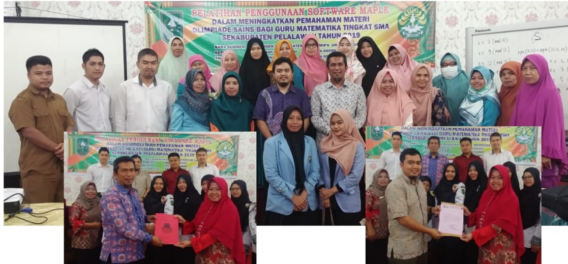
Gambar 2. Foto bersama, penyerahan modul dan sertifikat kegiatan

Pada setiap kegiatan tatap muka, Tim Pengabdian menyampaikan materi sekaligus menggunakan software Maple sebagai alat bantu. Hasil diskusi dikumpulkan dan dinarasikan untuk dijadikan modul yang akan digunakan pada akhir kegiatan dan sekaligus merupakan output/luaran dari kegiatan pengabdian ini. Demikian juga diantara setiap tatap muka akan diberikan tugas kepada peserta sehingga materi yang diberikan dalam pelatihan dapat dipahami lebih baik.