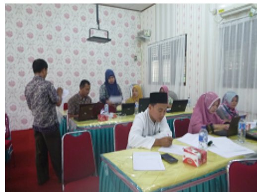
Gambar 4. Diskusi peserta pelatihan

Peserta yang mengikuti kegiatan pengabdian ini terlihat sangat antusias terutama dalam menggunakan software Maple dalam menyelesaikan problem solving yang berkaitan dengan materi Aljabar dan Teori Bilangan. Hal ini juga sesuai dengan data angket yang disebarkan Tim Pengabdian di akhir acara 98% peserta mengatakan sangat setuju kalau acara ini kembali diadakan.