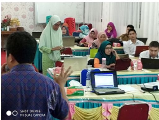
Gambar 3. Suasana kegiatan pelatihan