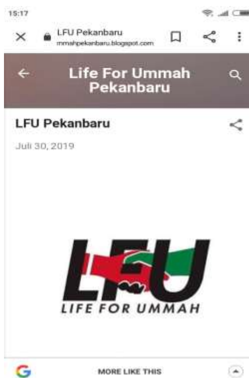
Gambar 3. Laman Blog Lifeforummah Pekanbaru