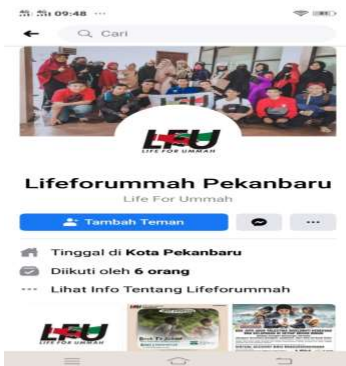
Gambar 1. Laman Facebook Lifeforummah Pekanbaru

LFU Pekanbaru membuat media komunikasi online yang aktif dipakai sampai saat ini yakni facebook “Lifeforummah Pekanbaru”. Pada facebook berita yang tampilan biasanya lebih singkat dari website. Secara detail ada beberapa bentuk tampilan laman media online yang digunakan dan dapat dilihat pada gambar berikut ini :