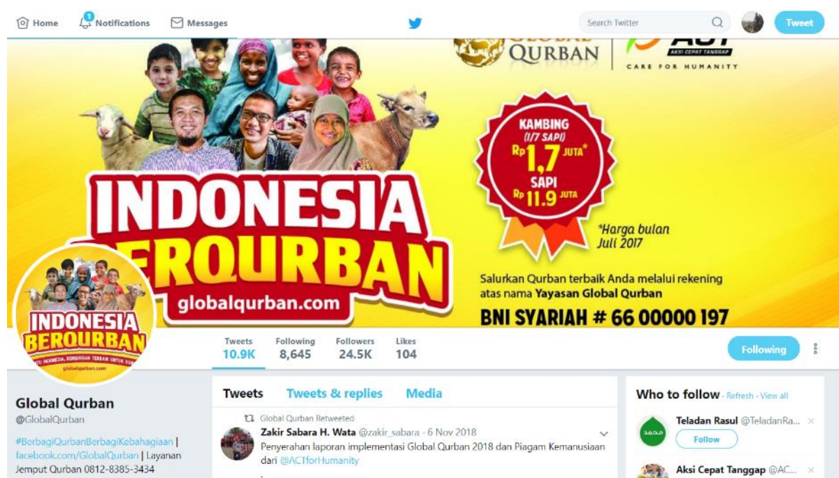
Gambar 3. Laman Akun Media Sosial Twitter Global Qurban Aksi Cepat Tanggap