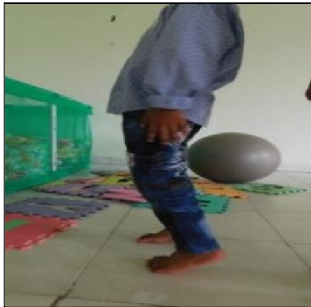
Gambar 1 Pola Jalan Anak dengan Idiopathic Toe Walking

Mekanisme yang mendasari berjalan berjinjit dengan persisten berhubungan dengan ketidakmatangan motor. Koaktivasi antagonis ekstremitas bawah mengkompensasi kekuatan otot yang terbatas sehingga push-off tidak ada. Kontrol motorik telah didefinisikan sebagai regulasi mekanisme yang penting untuk gerakan. Intervensi pengendalian motor diarahkan pada perubahan kapasitas gerakan, berbeda dengan intervensi ortopedi yang terutama berfokus pada pencapaian rentang gerak normal.