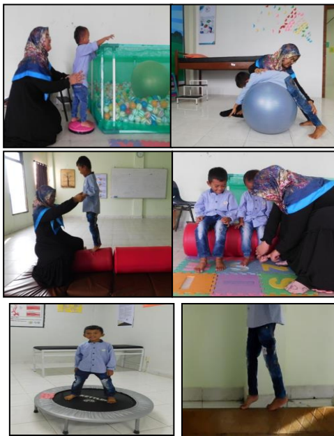
Gambar 3 Latihan Weight Bearing Activity

Kajian literatur sistematis terkini menyimpulkan bahwa program latihan multimodal yang menggabungkan latihan penguatan otot, gaya berjalan, keseimbangan, koordinasi dan fungsional memberikan efek manfaat yang lebih besar pada keseimbangan daripada program latihan biasa, setidaknya pada jangka pendek. Kebanyakan program latihan berlangsung selama 3 bulan dan dilakukan tiga kali seminggu selama satu jam [11].