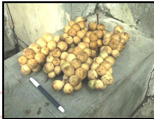
Gambar 2.3 Buah duku

Duku juga merupakan salah satu buah tropis, di Indonesia buah duku tersebar luas di daerah Sumatera, Kalimantan, Sulawesi dan Jawa. Buah duku mudah rusak dan berubah warna pada kulitnya menjadi kecoklatan setelah panen dalam waktu 4–5 hari, selain buahnya yang enak dan manis untuk dimakan, pada bagian kulit dan biji buah duku juga bermanfaat sebagai obat antidiare dan menurunkan demam dan pada kulit batang kayu buah duku bermanfaat sebagai obat malaria, diare dan penyembuh dari gigitan kalajengking, selain itu pada kulit dan biji buah duku banyak mengandung oleoresin yang berperan sebagai antidiare (Astawan M, 2009). Buah duku ( Lansium domesticum Corr) dapat dilihat pada Gambar 2.3