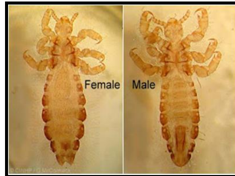
Gambar 2.1 Pediculus humanus capitis dewasa

Kutu rambut merupakan metamorfosis yang tidak sempurna yang terdiri dari telur → nimfa → dewasa. Pediculus humanus capitis memiliki panjang 1–3 mm, warnanya bervariasi berdasarkan warna rambut hospesnya bisa berwarna putih, keabu-abuan sampai gelap, Pediculus humanus capitis dapat bertahan selama kurang lebih 30 hari di kulit manusia sedangkan tanpa host kutu akan mati dalam waktu 1–2 hari (Bohl, 2015). Pediculus humanus capitis dewasa dapat dilihat pada Gambar 2.1