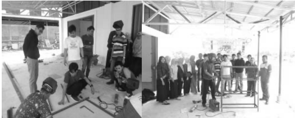
Gambar 6. Praktek Las Listrik