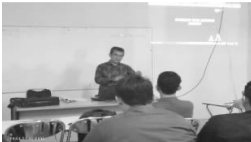
Gambar 4. Penyampaian Materi Sketsa