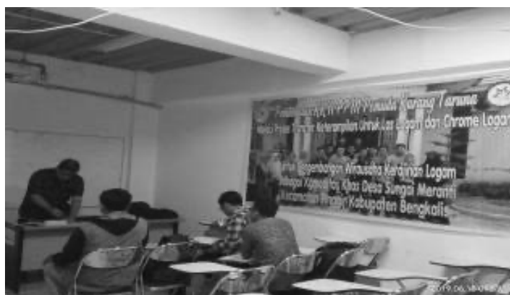
Gambar 5. Dasar pengelasan & pengenalan peralatan las