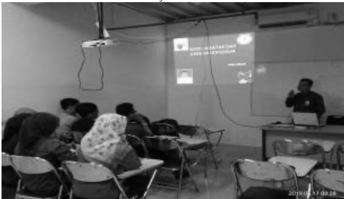
Gambar 2. Penyampaian Materi Kesehatan dan Keselamatan Kerja