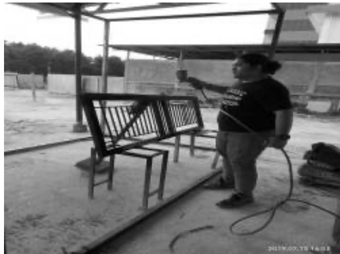
Gambar 7. Praktek Painting