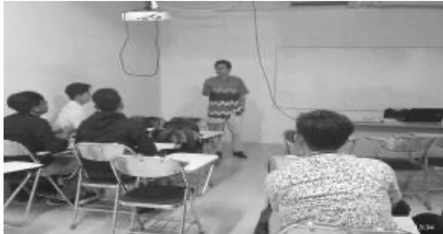
Gambar 3. Penyampaian Materi Alat Ukur