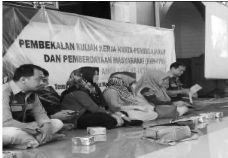
Gambar 1. Pembekalan oleh panitia KKN PPM bersama LPPM UMRI