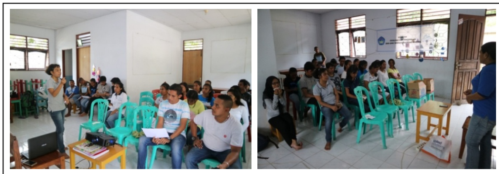
Gambar 2. Kegiatan Penyuluhan Pengenalan Jenis Teripang Bernilai Ekonomis Penting

Kegiatan pengabdian kepada masyarakat ini diinisiasi berdasarkan hasil penelitian penulis yang menemukan bahwa perairan Suli, secara khusus pada ekosistem lamun, memiliki sumberdaya teripang yang tinggi. Hal ini dikomunikasikan dengan beberapa pemuda desa yang aktif terlibat di dalam kegiatan desa maupun keagamaan, dan ditemukan bahwa salah satu tujuan tenaga pemuda produktif di desa adalah dapat memanfaatkan potensi desa untuk kemajuan masyarakat bersama, termasuk lingkungan pesisir yang menyediakan jasa dari sisi ekonomi maupun ekologi. Selain itu, dilihat bahwa pemanfaatan wilayah pesisir masih terbatas pada beberapa sumberdaya dari jenis kekerangan dan gastropoda (siput laut). Dan berdasarkan hasil diskusi, ditemukan bahwa hasil penelitian ini merupakan informasi baru yang dapat melengkapi pengetahuan masyarakat mengenai potensi perairan laut yang dimiliki desa.