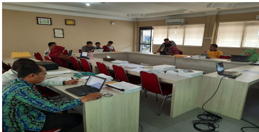
Gambar 2. Pelatihan Sister Di Fakultas Administrasi