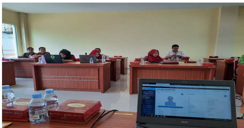
Gambar 3. Pelatihan Sister Di Pasca Sarjana

Kegiatan tersebut dilaksanakan dengan metode seminar. Pada tahapan pertama dosen diarahkan untuk mendaftar akun sister. Kemudian para dosen diarahkan untuk melengkapi data diri yang