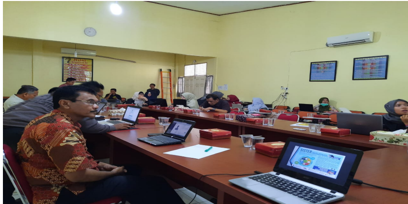
Gambar 1. Pelatihan Sister Di Fakultas Pertanian

aplikasi keluaran dari Kementerian Pendidikan Kebudayaan dan Pendidikan Tinggi Republik Indonesia. Aplikasi ini berfungsi mencatat semua identitas dosen berupa data diri, riwayat pendidikan, riwayat jabatan fungsional, riwayat pendidikan, riwayat pelaksanaan pendidikan, riwayat penelitian, riwayat pengabdian kepada masyarakat serta data pendukung lainnya.