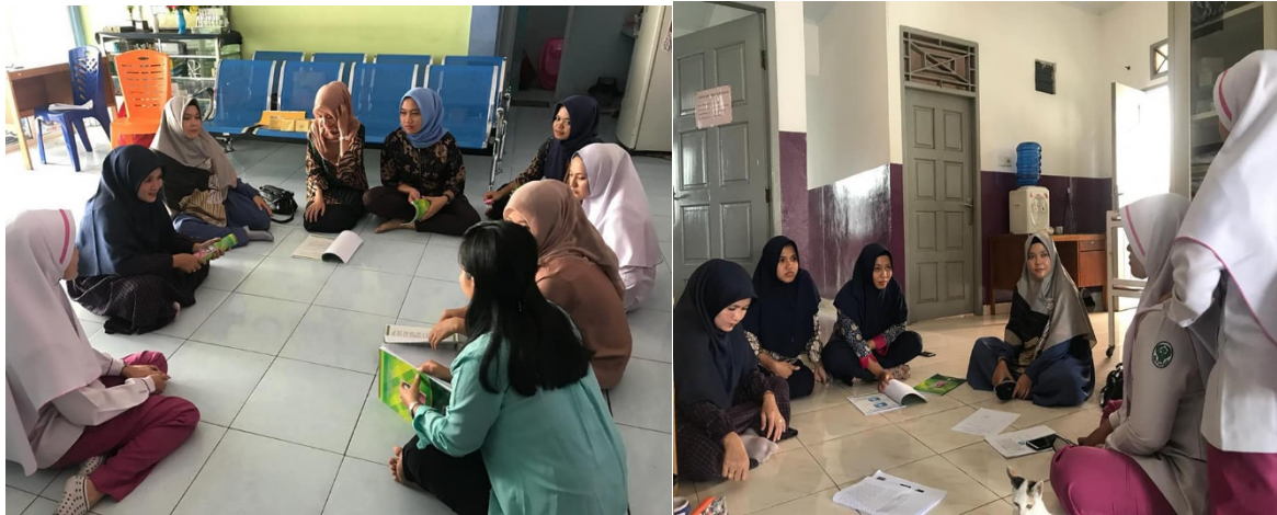
Gambar 1 : Sosialisasi Healing Touch kepada bidan