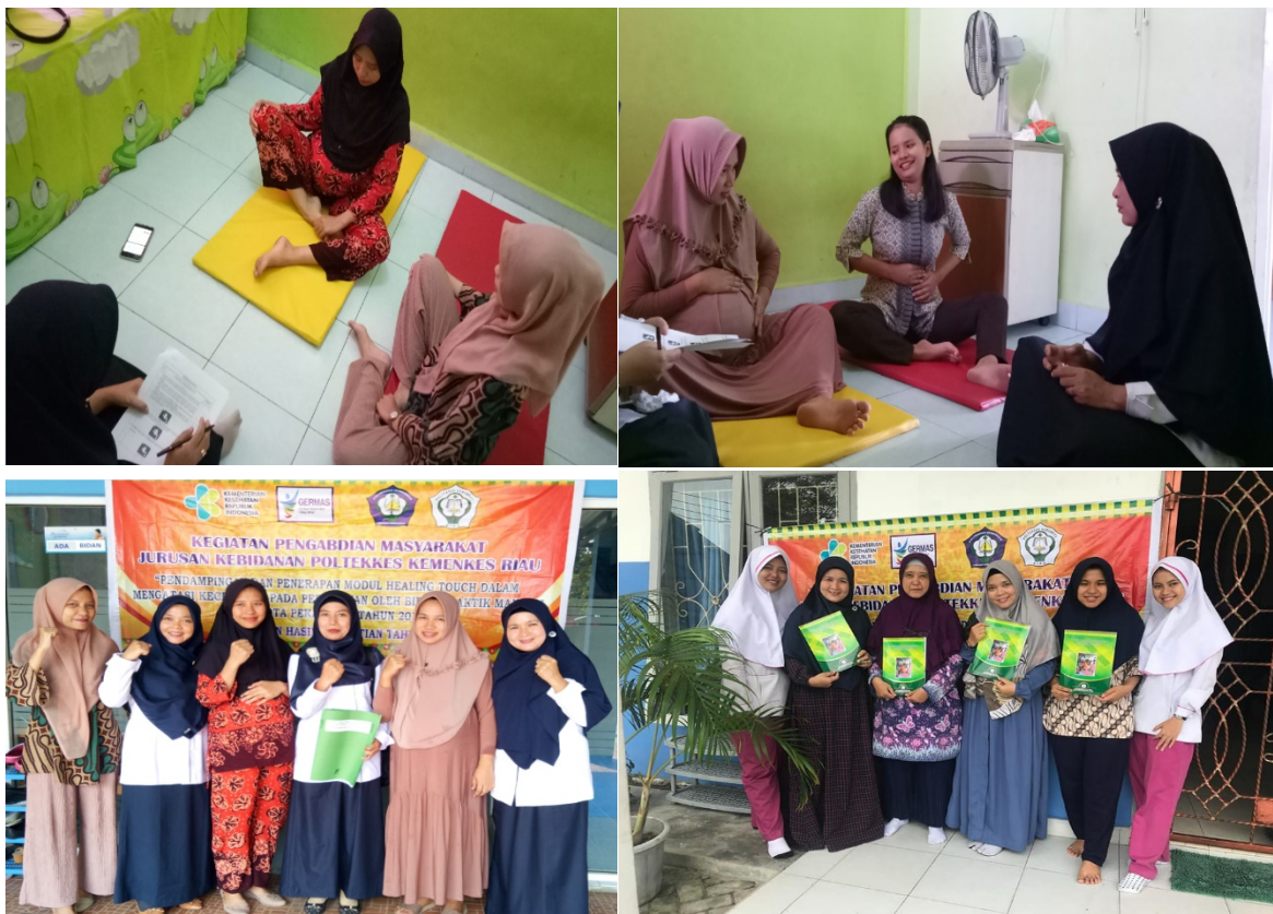
Gambar 2 : pendampingan, penerapan dan evaluasi pelaksanaan modul Healing Touch