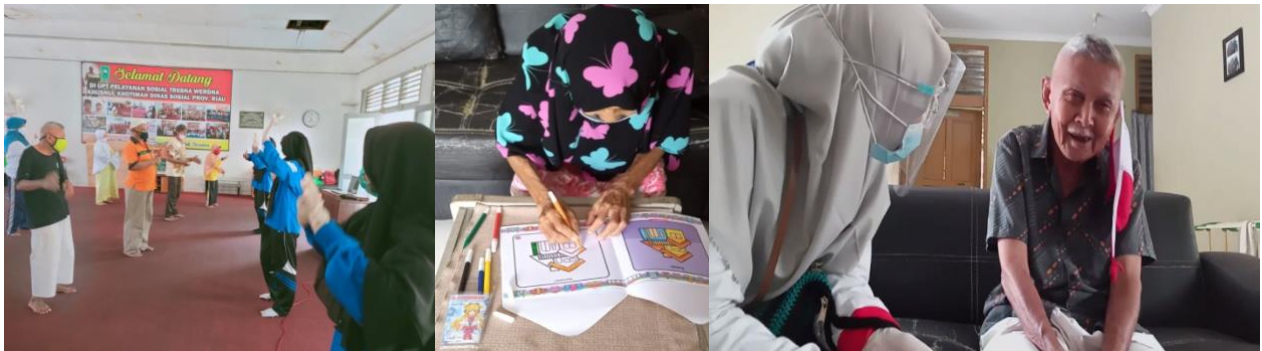
Gambar 1. Kegiatan Brain Gym , Art Therapy , dan Reminiscence Therapy

Gambar di atas adalah beberapa kegiatan yang dilaksanakan oleh tim pengabmas. Diawali dengan pengkajian dan screening terlebih dahulu kemudian menetapkan jumlah lansia yang dapat mengikuti kegiatan. Selanjutnya seluruh rangkaian kegiatan pengabmas dilakukan dengan protokol kesehatan.