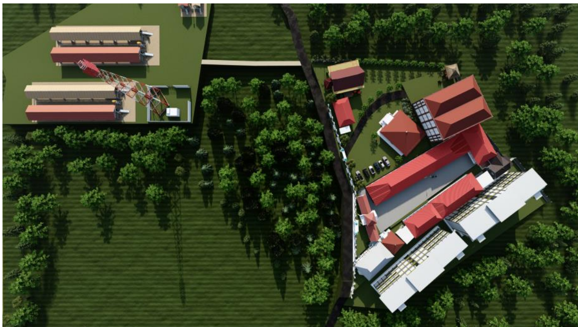
Gambar 4. Perspektif tampak atas seluruh bangunan pada rencana situasi

Adapun perspektif rencana situasi ditunjukkan dalam Gambar 4-6.