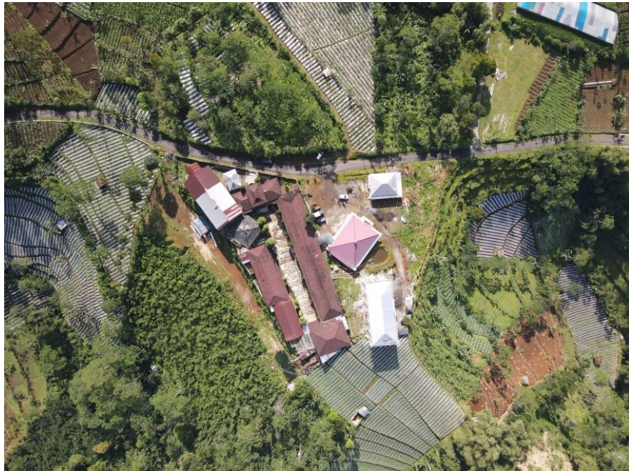
Gambar 2. Foto udara kondisi eksisting bangunan dalam kompleks Pondok Pesantren Istana Qur'an

Foto udara menggunakan drone dilakukan untuk mengetahui kondisi tata guna lahan dalam bangunan eksisting. Adapun drone map tersebut ditunjukkan dalam Gambar 2. Penggunaan bangunan yang telah ada meliputi Gedung MTs Muhammadiyah Sarwodadi, kantor, GOR, dan Masjid.