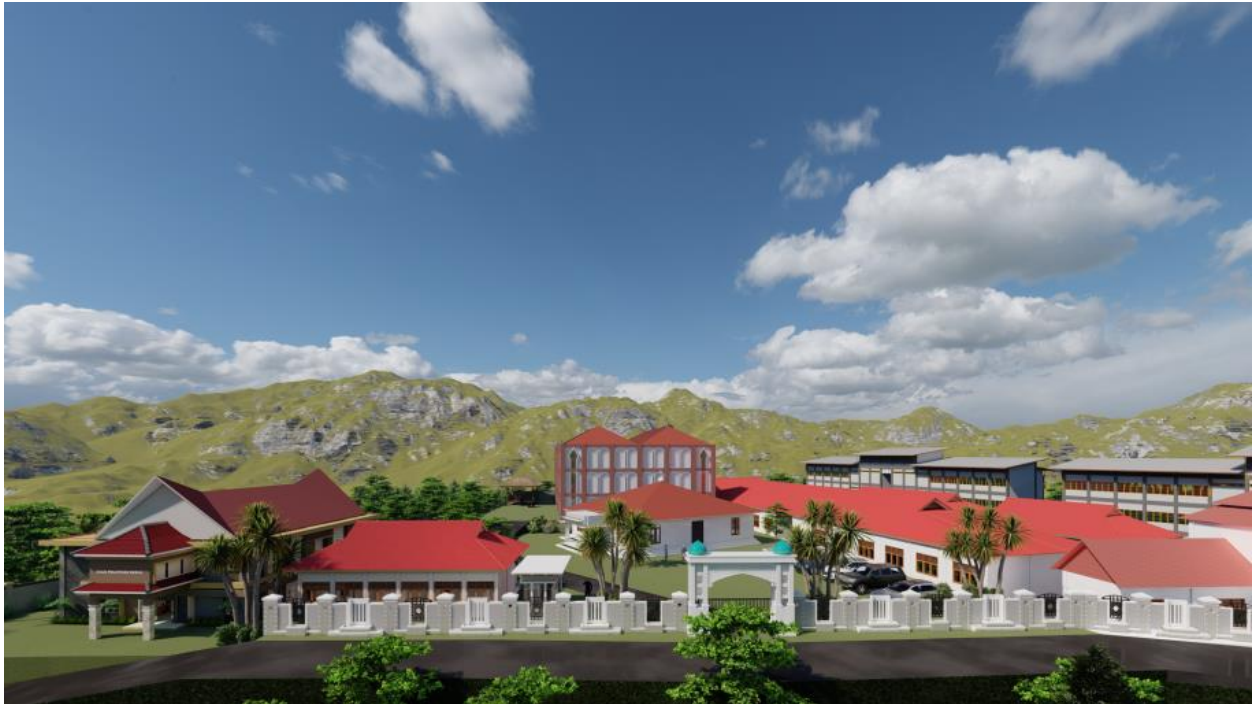
Gambar 6. Perspektif rencana situasi pada area Pendidikan

Setelah dilakukan seluruh rangkaian kegiatan, maka dilakukan evaluasi terhadap pemahaman masyarakat terkait konsep perencanaan site plan sesuai kaidah teknis berdasarkan penilaian pre-test dan post-test yang hasilnya ditunjukkan dalam Tabel 1. Penilaian tersebut dilakukan melalui kuisioner kepada seluruh pihak terkait sejumlah 20 responden, untuk mendapatkan informasi persentase pemahaman para mitra terkait proses perencanaan site plan , proses survey pendahuluan dan lapangan, proses analisis dan konsep, kaidah lingkungan dalam tata guna lahan, dan pembangunan yang berkelanjutan. Dari hasil tersebut didapatkan nilai rerata pemahaman total hasil post test pada seluruh aspek terdapat kenaikan, dari 6,2% menjadi 92,4%. Oleh karena itu, dapat disimpulkan bahwa kegiatan ini bermanfaat dan dapat meningkatkan pemahaman mitra.