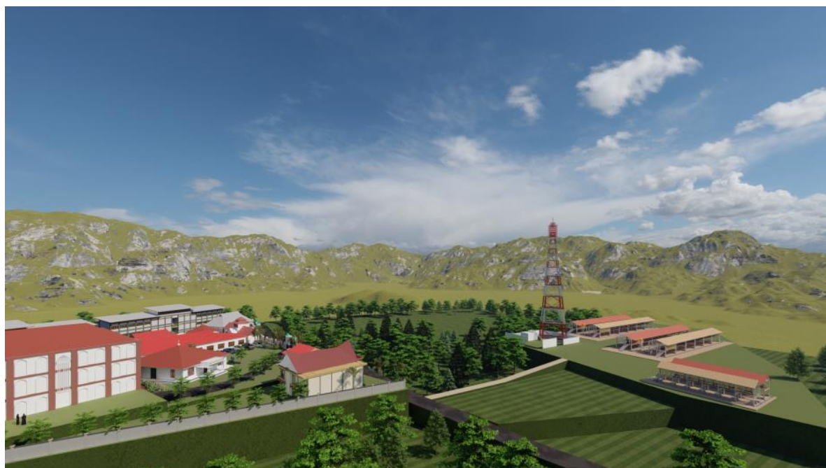
Gambar 5. Perspektif dari klinik, pertokoan, dan sarana olahraga pada rencana situasi