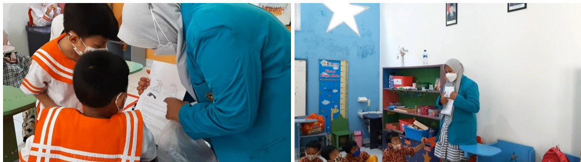
Gambar 4. Penyuluhan flat foot

Gambar 3 merupakan kegiatan pemeriksaan arkus dengan melakukan pengecapan telapak kaki atau wet foot . Kegiatan ini diawali dengan membagi 2 kelompok dari masing-masing kelas lalu meminta anak untuk menuliskan nama dan mengantri untuk pengecapan.