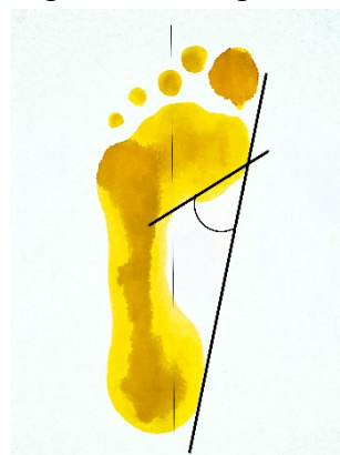
Gambar 2. Clarke's Angle Test

Pengukuran clarke's angle test ini setiap peserta diminta untuk meletakkan kakinya di atas kertas yang sebelumnya telah diberi cat atau tinta yang sudah dilarutkan dengan air. Lalu tekan kaki kanannya yang sudah berada di atas kertas, kemudian secara bergantian tekan kaki kirinya juga yang sudah berada di atas kertas. Kemudian meminta peserta untuk berdiri dengan stabil dan melihat ke depan selama kurang lebih 2 detik, lalu kaki subjek dibersihkan dari cat [10]. Penghitungan clarke's angle test menggunakan spidol, penggaris, dan busur derajat [10]. Clarke's angle test di ukur menggunakan 2 sudut garis. Garis pertama menghubungkan antara tepi medial caput metatarsal satu dengan tumit, garis kedua menghubungkan antara tepi caput metatarsal satu dengan pusat lengkungan arkus longitudinal dari sisi medial [11].