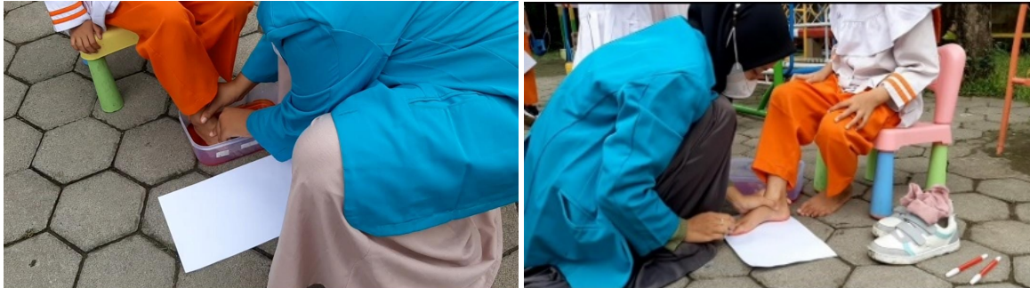
Gambar 3. Pemeriksaan Arkus

KB Al-Quran Terpadu Bintangku Surakarta, terdapat 14 anak kaki kiri nampak lengkung kaki, 19 anak kaki kanan nampak lengkung kaki, 39 kaki kiri belum nampak lengkung kaki, 33 kaki kanan belum nampak lengkung kaki. Hasil observasi tersebut usia anak kelas keaja adalah 5 hingga 6 tahun, tentu saja ini dapat di katakan sebagai hasil gangguan fisiologis.