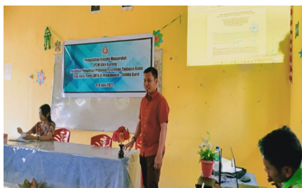
Gambar 3. Penyampaian Materi

Desain evaluasi untuk mengukur keberhasilan pelatihan meliputi pengetahuan dan pemahaman penulisan karya ilmiah, meliputi sifat karya ilmiah, ragam karya ilmiah, sistematika penulisan karya ilmiah, dan komponen artikel jurnal ilmiah [16]. Melalui pendekatan personal pada setiap pelatihan yang dilakukan, seluruh pendidik diharapkan mampu membuat artikel ilmiah dari laporan hasil PTK tanpa batasan dengan mengetahui kaidah-kaidah pembuatan artikel ilmiah [17].