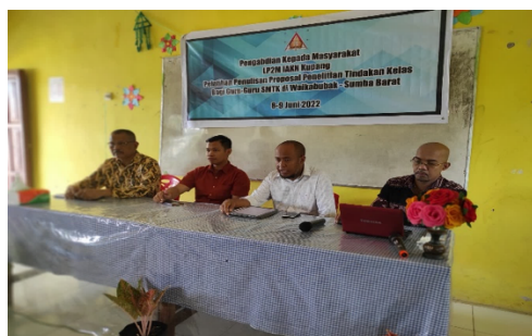
Gambar 3. Penyampaian Materi

Materi yang disampaikan berdurasi satu jam. Pemateri menyampaikan cara mengatasi kendala dalam penulisan proposal.