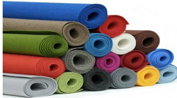
Gambar 3. Kain Flanel dengan berbagai pilihan warna

Banyak bangsa yang memiliki legenda dalam kebudayaannya tentang pembuatan kain felt atau flanel ini. Legenda dari Sumeria mengklaim bahwa pembuatan flanel untuk pertama kalinya ditemukan oleh seseorang yang bernama Urnamman, [2]. Tradisi membuat kain felt juga masih dipraktikkan oleh kaum nomadic di Asia Tengah untuk membuat permadani, tenda atau pakaian. Di Barat flanel juga digunakan secara luas sebagai media untuk berekspresi dalam dunia seni tekstil seperti halnya seni desain.