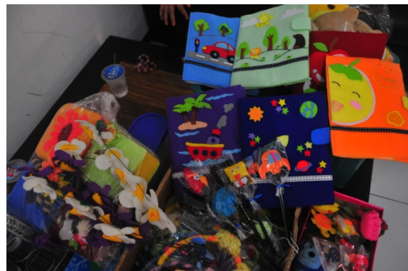
Gambar 1. Produk-produk dari bahan flanel dari UKM”Toko ijo asesoris”

UKM “Toko ijo asesoris” memulai usahanya pada tahun 2007 berlokasi di Bukit Kencana Jaya, Kelurahan Meteseh, Kecamatan Tembalang. Produk-produk kerajinan flanel yang telah dihasilkan beraneka ragam, antara lain: baju dan kaos anak-anak, gantungan kunci, sandal dan berbagai pernik-pernik lainnya. Produk andalan “Toko ijo asesoris” ini adalah macam-macam aplikasi hiasan jahit yang biasa digunakan sebagai hiasan baju, kaos maupun pakaian lainnya seperti mukena dan jilbab. Produk-produk kerajinan tangan flanel dapat dilihat pada Gambar 1.