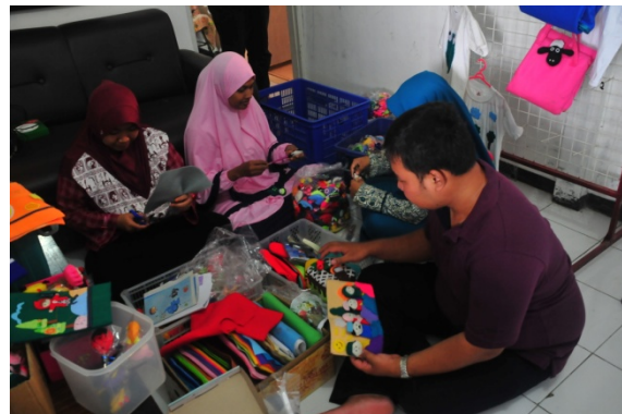
Gambar 2. Kegiatan pada UKM “Toko ijo asesoris”

UKM “Toko ijo asesoris” selain memproduksi kerajinan tangan flanel, juga terlibat dalam penjualan dan pemasaran produk-produknya. Pemasaran produk-produk UKM “Toko ijo asesoris” masih bersifat tradisional yaitu dengan memasukkan barang-barang hasil produksi ke pedagang-pedagang pasar ataupun toko-toko pernak-pernik. Namun tak sedikit pula order yang bersifat pesanan sesuai dengan kebutuhan pelanggan, misalnya untuk souvenir ulang tahun, pernikahan ataupun hajatan yang lain. Aktivitas produksi kerajinan flanel di UKM “Toko ijo asesoris” dapat dilihat pada Gambar 2.