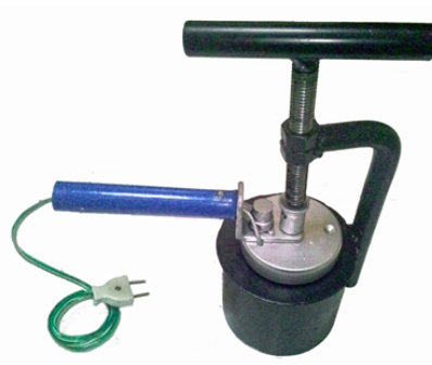
Gambar 5. Desain mesin press untuk para pengrajin flanel

Pada tahapan ini telah dikembangkan desain alat polishing bagi para pengrajin batu ambar. Desain alat polishing disesuaikan dengan kebutuhan pengrajin batu ambar dalam memoles batu ambar. Alat ini memiliki bagian yang berputar terus menerus dan bagian ini sudah dilapisi oleh serbuk intan, bagian ini berguna sebagai tempat memoles batu. Alat ini mempunyai kelebihan dibanding dengan polishing manual, lebih cepat dan dapat meminimal kerusakan pada batu ambar. Sifat batu ambar yang mudah pecah dan mudah tergores mengakibatkan banyak masalah pada saat memoles dengan cara manual. Dengan adanya alat polishing masalah tersebut dapat dihindarkan karena pengrajin batu ambar dapat mengontrol kecepatan putar alat sesuai dengan kebutuhan pemolesan.