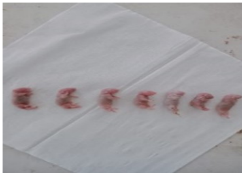
Gambar 2. Janin Normal Mengalami Kematian (Dosis 500 mg/kg BB)