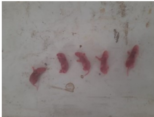
Gambar 1. Janin Normal (Kontrol)

sehat. Pada dosis 500 mg/kg BB berat badan dan jumlah janin normal tetapi mengalami kematian. Pada dosis 1500 mg/kg BB berat badan dan jumlah janin tidak ditemukan adanya efek teratogenik. Hasil penelitian menunjukkan tidak ada perbedaan jumlah janin yang signifikan antara kontrol dengan perlakuan pada dosis 500 mg/kg BB. Sedangkan perbandingan jumlah janin antar perlakuan dosis 1500 mg/kg BB tidak ada, karena tidak ditemukannya janin mencit.