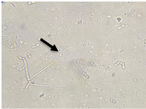
Gambar 2 Hasil Pemeriksaan Uji Germ Tube

Hasil penelitian dari responden wanita yang menderita diabetes mellitus yang melakukan pemeriksaan di Puskesmas Karanganyar sebanyak 19 responden (100%) yang sesuai kriteria dengan hasil positif teridentifikasi Candida albicans pada sampel urine. Dari hasil pemeriksaan kadar gula darah sewaktu 18 responden (94,7%) memiliki kadar gula darah lebih dari normal dan 1 (5,3%) diantaranya memiliki kadar gula darah normal, dapat diartikan responden memiliki kontrol gula darah yang baik